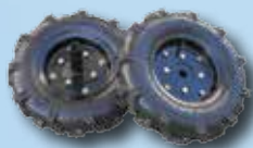
Roți pneumatice 400 mm