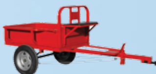
Remorcă - 400kg